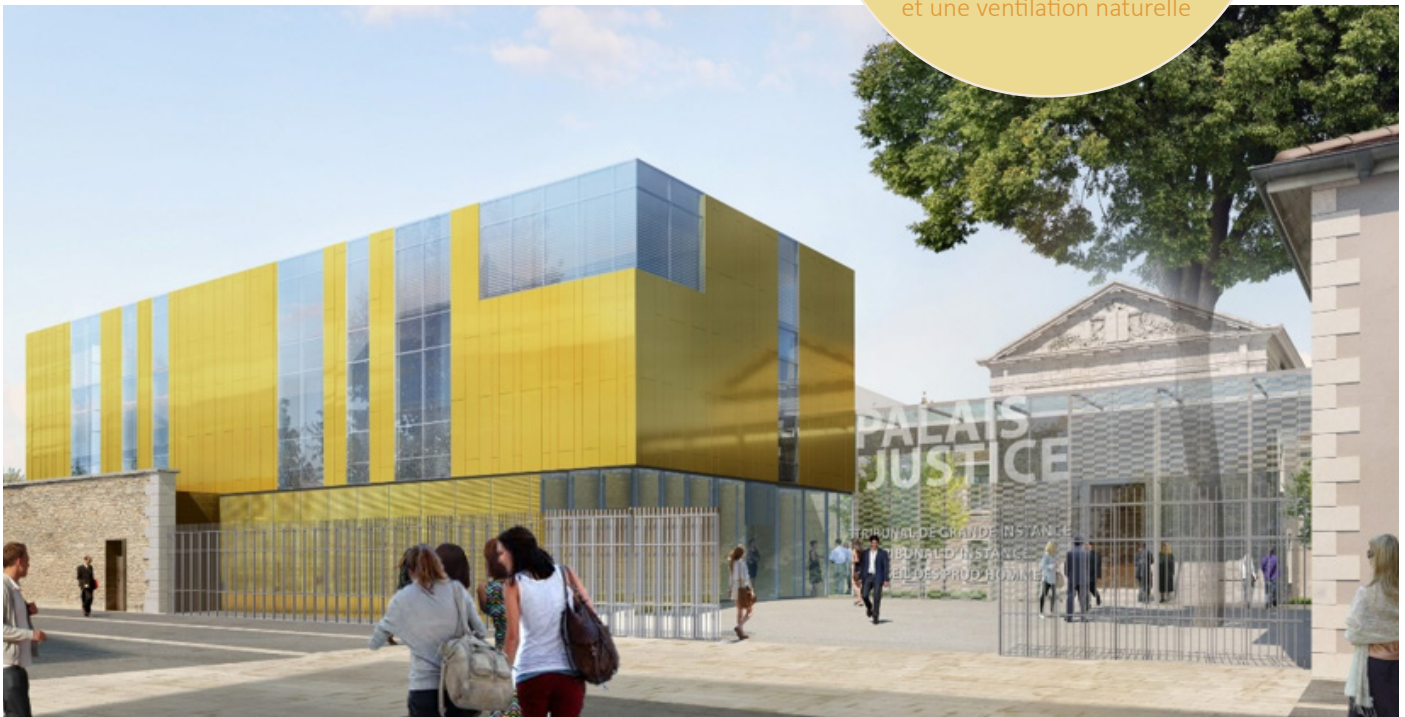
Perspective- Garbit et Blondeau

La salle des pas perdus conçue comme une serre bioclimatique : elle capte les calories solaires en hiver et contribue de manière passive aux économies de chauffage. En été, des ouvertures en partie haute permettent l'évacuation de l'air chaud et une ventilation naturelle