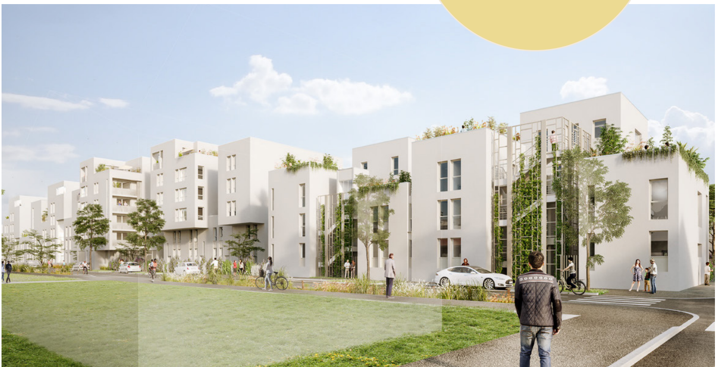
Perspective- Insolites Architecture

La récupération de chaleur sur air extrait de la VMC simple flux pour préchauffer l'eau chaude sanitaire et la production photovoltaïque autoconsommée